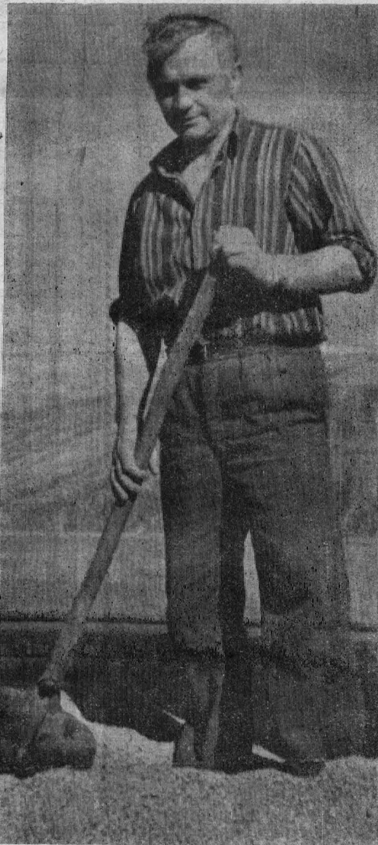
НА СНИМКЕ: А. М. Третьяков.