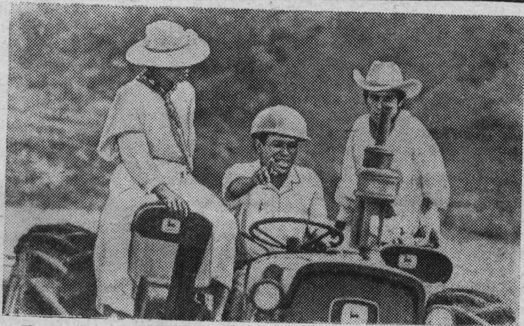
Правительство Мексики осуществляет программу улучшения условий жизни индейцев. В пустынном районе гор Западной Сьерра-Мадре живет почти 9-тысячное индейское племя. Представители его говорят на древнем ацтекском языке. Бережно относясь к их культуре, уважая обычаи и образ жизни, правительство оказывает им помощь в строительстве школ, в обработке земли. На снимке: инструктор обучает индейцев управлению трактором.