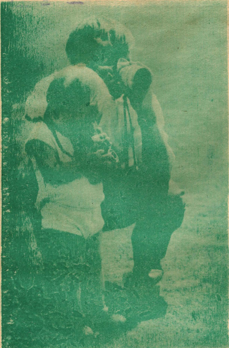
Областная выставка художественной и документальной фотографии «Земля моя Кузнецкая».