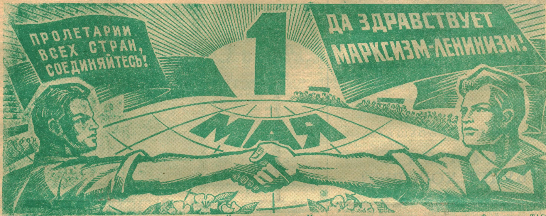
Плакат издательства «Молодая гвардия».