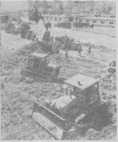
Киргизская ССР. В Сузакском районе Ошской области механизированные звенья производят заготовку кормов.

На снимке: укладка зеленой массы в сенажные траншеи межкочхозного откормочного комплекса.