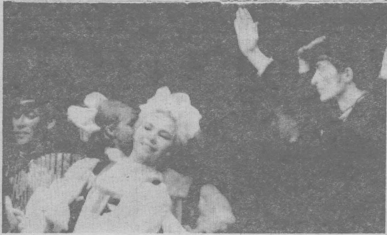
Большой популярностью в области и за ее пределами пользуется народный танцевальный ансамбль «Шахтерский уголек». На недавнем Всекузбасском фестивале молодежи этот самодельный коллектив был удостоен Диплома I-й степени. На снимке: шуточный танец.