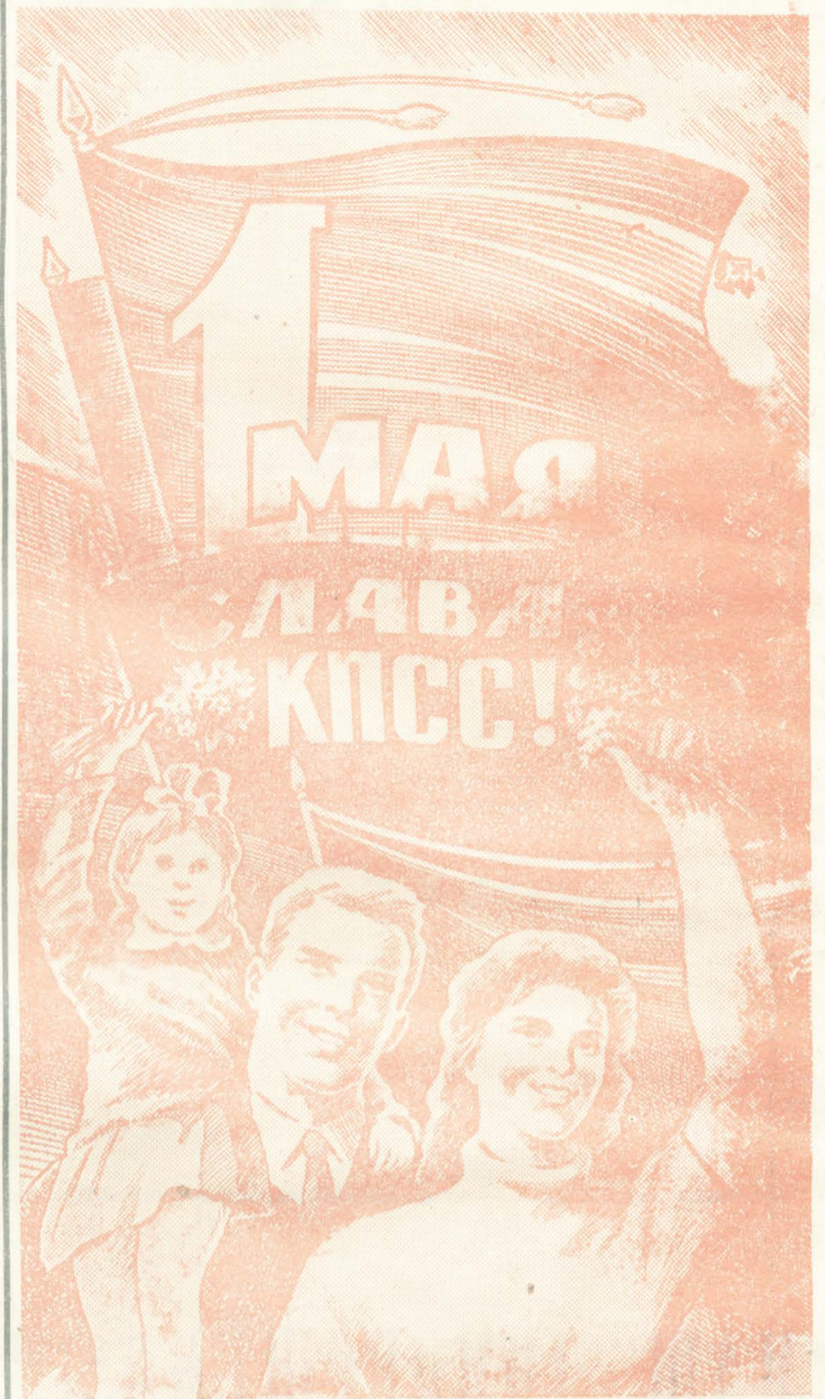
Рисунок художника С. Андреева.

Хороших успехов в предмайском соревновании добились животноводы колхоза им. Мичурина: они более чем на сорок процентов перевыполнили полугодовые обязательства по продаже мяса государству. Значительно