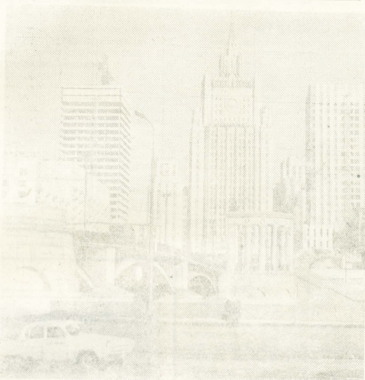
МОСКВА. В столице ведется большое строительство. НА СНИМКЕ: вид со стороны Бережковской набережной на строящийся корпус гостиницы «Интурист» (слева) на Смоленской площади.

Кто-то из раненых тихо, как бы про себя, заметил: «И чего только не бывает на войне».