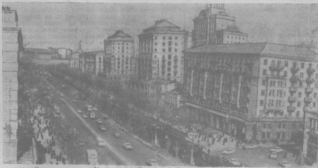
Киев — столица Украинской Советской Социалистической Республики. НА СНИМКЕ: центральная магистраль города — Крещатик.

В. КОЖЕВНИКОВ, секретарь оборотного депо.