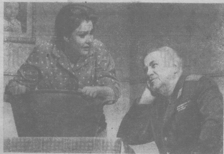
МОСКВА. «Самый последний день» — так называется новый спектакль, поставленный в Государственном академическом Малом театре Союза ССР народным артистом СССР Б. И. Равенских по пьесе Бориса Васильева. Художник — В. Ю. Шапорин.

Огромные перспективы сулит дальнейшее освоение космоса. В Директивах XXIV съезда КПСС на девятую пятилетку предусмотрено обеспечить проведение научных работ в космосе в целях развития дальней телефонно-телеграфной связи, телевидения, метеорологического прогнозирования и изучения природных ресурсов, географических исследований и решения других народнохозяйственных задач с помощью спутников, автоматических и пилотируемых аппаратов, а также продолжения фундамен-