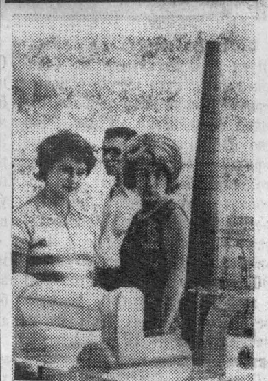
На снимке: в павильоне «Охрана природы». Посетители у стенда Макеевского металлургического комбината. Очистные сооружения этого предприятия отличаются простотой конструкции, эффективной работой, они позволяют неоднократно использовать воду.