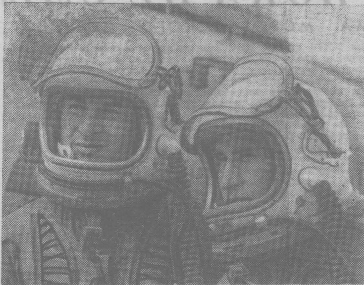
Воины-авиаторы Советских Военно-Воздушных Сил изо дня в день настойчиво совершенствуют свою боевую выучку, уверенно овладевают высотами летного мастерства, увеличивая ряды классных специалистов. Почетное звание отличных посят многие экипажи, отряды и группы обслуживания. Летчики, штурманы, техники и другие авиационные специалисты надежно обеспечивают защиту воздушных границ нашей Родины.