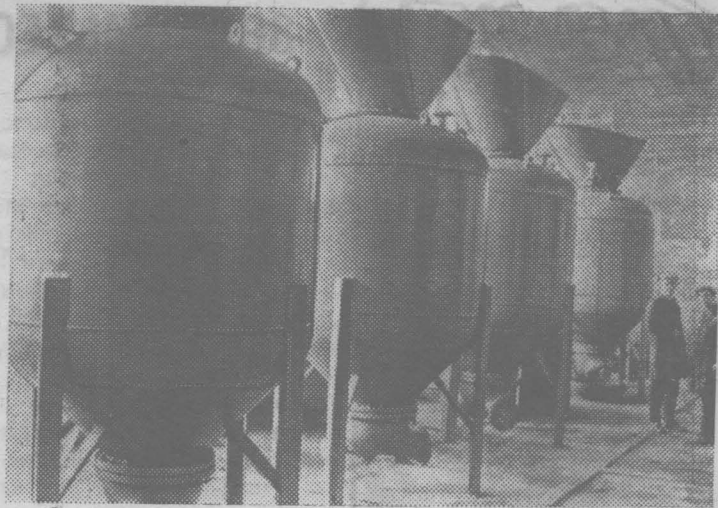
Мордовская АССР. Серийное производство камерных питателей начато в нынешнем году на Рузаевском заводе химического машиностроения. Новые агрегаты предназначены для механизации уборки помещений на животноводческих фермах. До конца первого года пятилетки предприятие выпустит 800 питателей.