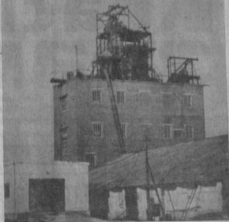
На Промышленновском хлебоприемном пункте близится к концу строительство и монтаж зерноочистительно-сушильного комплекса «Целинная». Такая установка монтируется впервые в области. Производительность ее 50 тонн зерна в час. Процессы подработки и сушки хлеба на этом комплексе будут полностью механизированы. К осени будущего года новый зерноочистительно-сушильный агрегат будет сдан в эксплуатацию.

Устный словарный диктант. Школьники кратко раскрывают содержание понятий: экономический кризис, империализм, монополия, банк, концентрация капитала, финансовая олигархия, безработица, ленинизм. Кратко вспоминает основные события революционного движения в начале XX века, учитель переходит к изучению новой большой темы: «Борьба за создание марксистской партии в России». Нет на уроке, так называемой, школьной лекции, нет в чистом виде и самостоятельной работы над учебником, но есть напряженная работа всего класса, живое слово учителя, работа над отдельными местами учебника, четкие записи выводов в тетрадь. Шаг за шагом вырастает в представлении учащихся гениальный образ В. И. Ленина и его дитя — «Царя», раскрывается глубокий смысл его борьбы с оппортунизмом. Ровно десять минут остается до конца урока, когда в классе гаснет свет, включается киноаппарат. На экране учебный фильм «Ленин в ссылке и эмиграции». Вместе со-