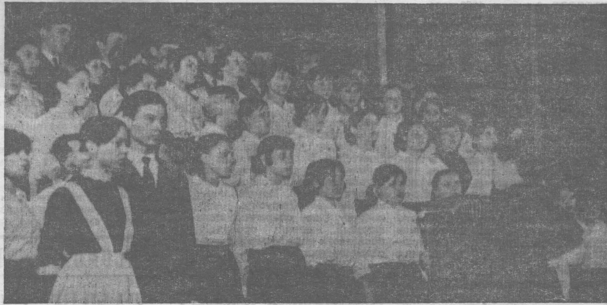
Хор Промышленовской средней школы № 2 исполняет песню «Над Россией ленинский свет».