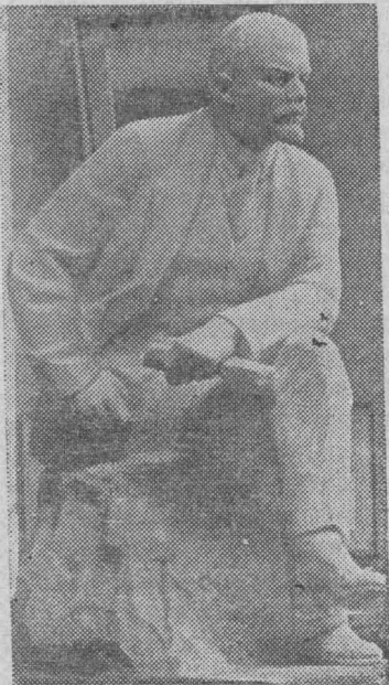
Образ вождя революции — Владимира Ильича Ленина — неиссякаемая тема в искусстве.

За годы Советской власти в нашей стране и за рубежом создано много художественных произведений, посвященных Владимиру Ильичу Ленину. Значительное место среди них занимает скульптура. Еще при жизни Владимира Ильича были созданы его скульп-