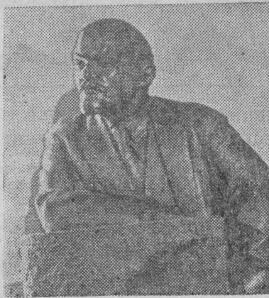
На снимках: слева — «В. И. Ленин». Скульптор Н. Щербаков. Экскурсанты у скульптуры В. Пинчука «В. И. Ленин в Разливе».

В числе более поздних скульптур, созданных за последние 30 лет, — «В. И. Ленин в Разливе», В. Б. Пинчука, модель памятника в Ульяновске, созданного М. Г. Манизером, — одно из лучших произведений советской Ленинианы, скульптурные портреты, выполненные Н. В. Томским, А. В. Бабичевым, А. И. Посядо и дру-