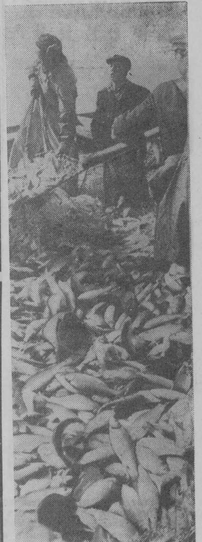
Астраханская область. Полным ходом идет весенняя лодка на Нижней Волге. Тысячи пудов рыбы ежедневно сдают рыбаки государству.