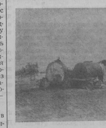
На снимке: вот так выглядит площадка для хранения нефтепродуктов в колхозе «Гигант».

Все эти факты известны и бригадирам комплексных бригад, и главному инженеру, и правлению колхоза, однако мер для наведения порядка с использованием и хранением нефтепродуктов никто не принимает. А между тем при такой организации работы, пожалуй, ни одна сотня рублей ушла бы в землю вместе с пролитым топливом и маслами. Немалый ущерб понесло хозяйство от быстрого износа тракторов в результате использования загрязненного песком и пылью смазочных масел и топлива.