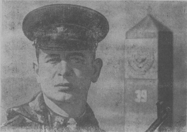
28 мая исполняется пятьдесят лет с того дня, как Владимир Ильич Ленин подписал декрет об образовании пограничной охраны Страны Советов.

Полвека зорно стерегут рубежи нашей Родины советские пограничники. Их ратный труд вершится беспрестанно — и днем, и ночью, в любую погоду, во все времена года.