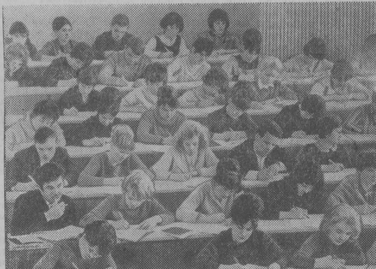
На снимке: на лекции.

В распоряжении студентов — десятки хорошо оборудованных учебной аппаратурой и наглядными пособиями кабинетов и лабораторий, четыре большие лекционные аудитории, актовый и спортивный залы, библиотека на 200 тысяч томов, три благоустроенных общежития.