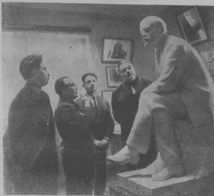
Ульяновск. Накануне 98-летия со дня рождения вождя пролетариата особенно много экскурсантов в комнатах Дома-музея В. И. Ленина и в залах Ульяновского филиала Центрального музея В. И. Ленина. Люди из разных городов страны, жители Ульяновска, городов и сел области еще и еще раз знакомятся с симбирским периодом биографии Ильича.

В воскресенье, 21 апреля, в 11 часов дня в клубе им. Кирова состоится первая конференция, на которой будет избран руководящий состав общества сроком на два года, а также будет производиться прием в члены общества. Желательно, чтобы в этой конференции приняли активное участие учителя школ, особенно историки и географы, а также работники клубов, библиотек, участники гражданской и Отечественной войн. В заключение будет продемонстрирован художественный фильм. Я. ЧЕРНОВ.