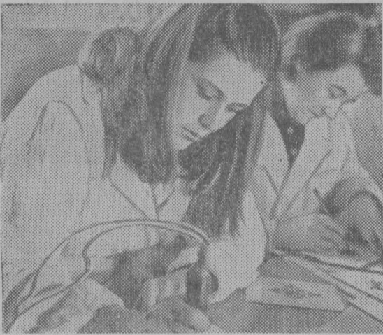
Латвийская ССР. Недавно колхоз «Адажи» Рижского района стал «конкурентом» латвийских предприятий, занимающихся изготовлением сувениров. Изящные подсвечники, декоративные тарелки, традиционные миниатюрные пивные бочонки, оригинальные штатгалки — таков далеко не полный перечень новой