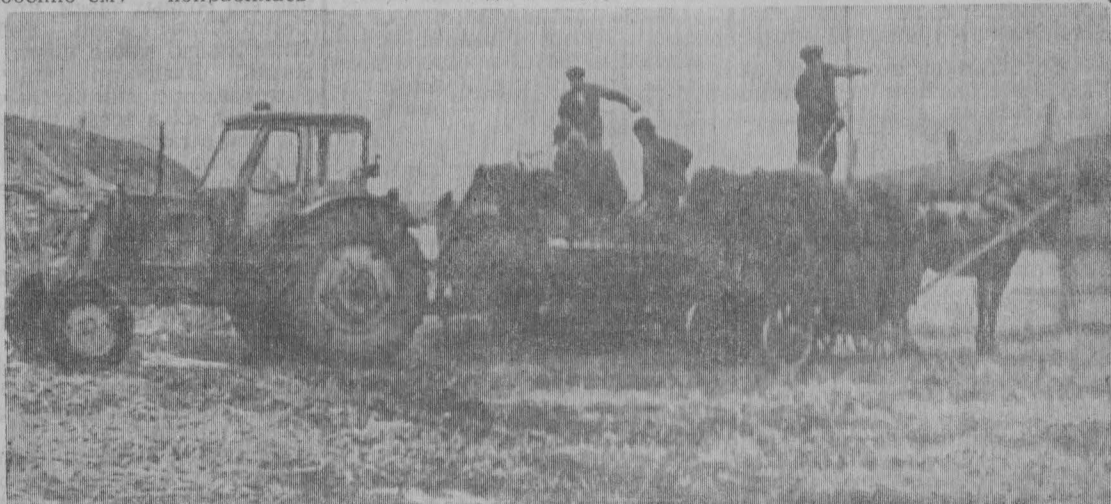
На снимке: скотники разгружают силос с тракторной тележки.