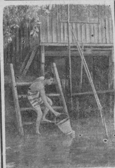
Жизнь миллионов тайландцев проходит на берегах рек и каналов. Прямо в лодках и домах на сваях живут рыбаки и грузчики со своими семьями.