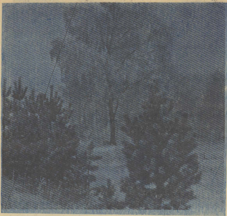
Здравствуй, племя молодое...