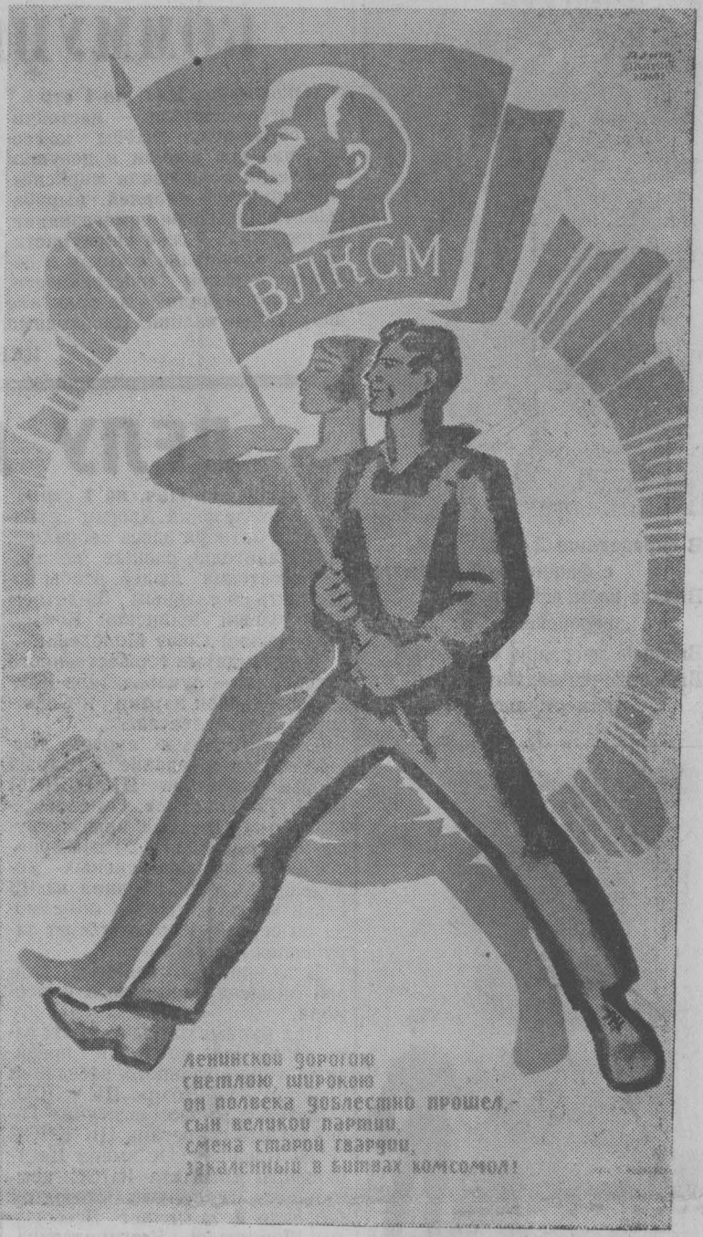
Ленинской дорогой светлую широкую Он полвека доблестно прошел, — сына великой партии, сменив старую гвардию, закаленный в битвах КОМСОМОЛ!

Летчик-космонавт товарищ Береговой продолжает успешно выполнять намеченную программу экспериментов и исследований.