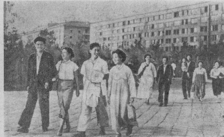
На снимке: на одной из улиц Пхеньяна.

рая традиция отмечать праздники массовыми играми и танцами буквально повсюду — и в больших городах и в горных деревушках. Танцуют и поют все — мужчины и женщины, старики и дети — под своеобразный ритм национальной корейской музыки. В День Республики — 9 сентября — массовые гулянья принимают особый характер. Трудящиеся республики в этот день не только веселятся — они подготавливают успехи, достигнутые еще за один год существования народного государства, берут обязательства по претворению в жизнь планов на будущее.