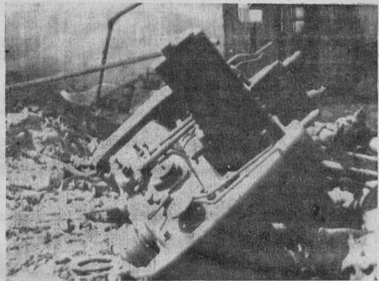
А здесь станок среди хлама.

Тракторист сосредоточенно что-то ищет у склада запасных частей.