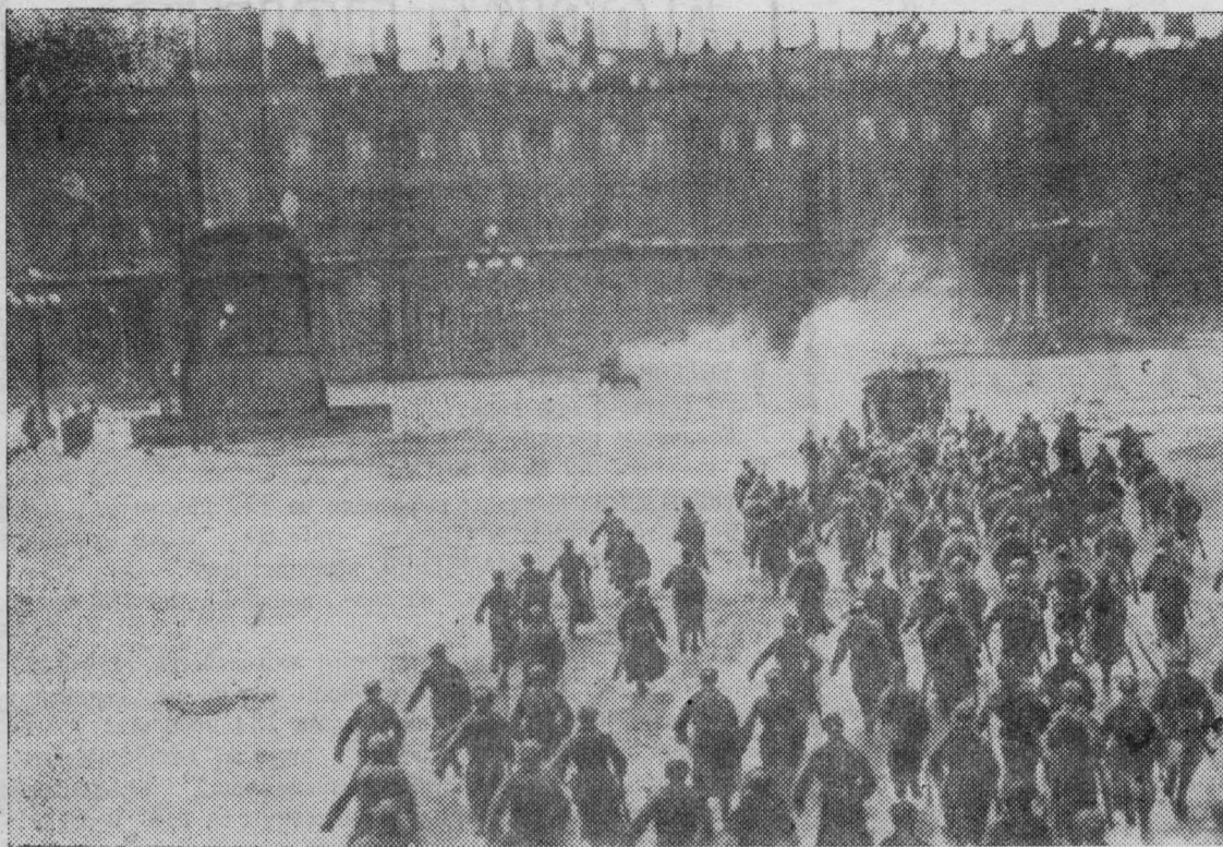
Петроград. 1917 год. Штурм Зимнего дворца.