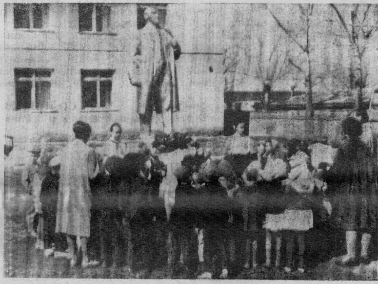
На снимках: дошкольники и ученики школы № 136 возлагают к памятнику В. И. Ленина венки.