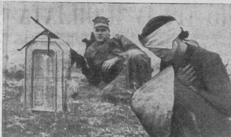
Южный Вьетнам. Этот снимок сделан близ Дананга корреспондентом американского агентства ЮПИ. Женщина, которая взята в плен во время операции прочесывания, с завязанными глазами. Сзади нее морской пехотинец США с автоматом.