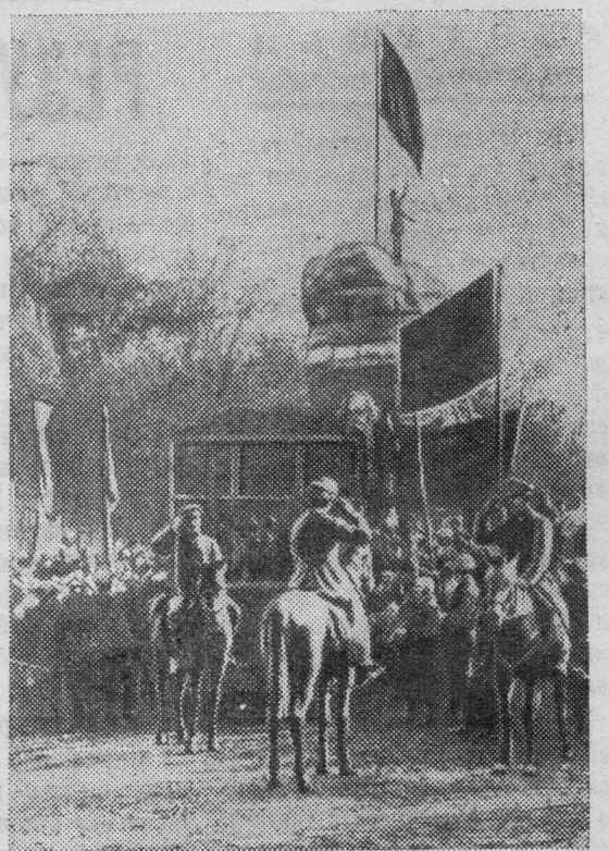
Поднятие Красного знамени в честь провозглашения Советской власти в Ташкенте.

Почти полвека прошло с той поры, когда Ленин, выступая 25 октября (7 ноября) 1917 года с докладом о задачах власти Советов на заседании Петроградского Совета, сказал: «Отныне наступает новая полоса в истории России, и данная, третья русская революция должна в своем конечном итоге привести к победе социализма». Пророческие слова великого вождя революции сбылись. Завершив построение социализма, советский