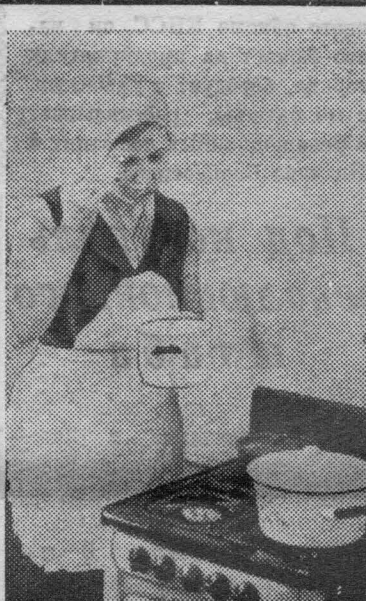
Газифицируются города и села Тюменской области. Голубой огонь горит в квартирах трудящихся Тюмени: Хангы-Мансийска, Салехарда, Тобольска, Ишима, в селах Абатское, Ярково, Казанское и других.

В чем же наши ошибки в агротехнике? В первую очередь в обработке земли. Мы мало уделили внимания безотвальной вспашке почвы. По сравнению с отвальной пахотой на безотвальной сборы зерна пшеницы оказались выше на 0,8 ц, ячменя — на 5,4 ц, овса — на 3,8 ц с га. Хозяйство опаздывает с ранне-весенним боронованием почвы, что приводит к большим потерям влаги и снижению урожая. Вред наносит и лушение. На участках второй бригады, где перед севом почва обрабатывалась луштыльниками, урожай зерновых