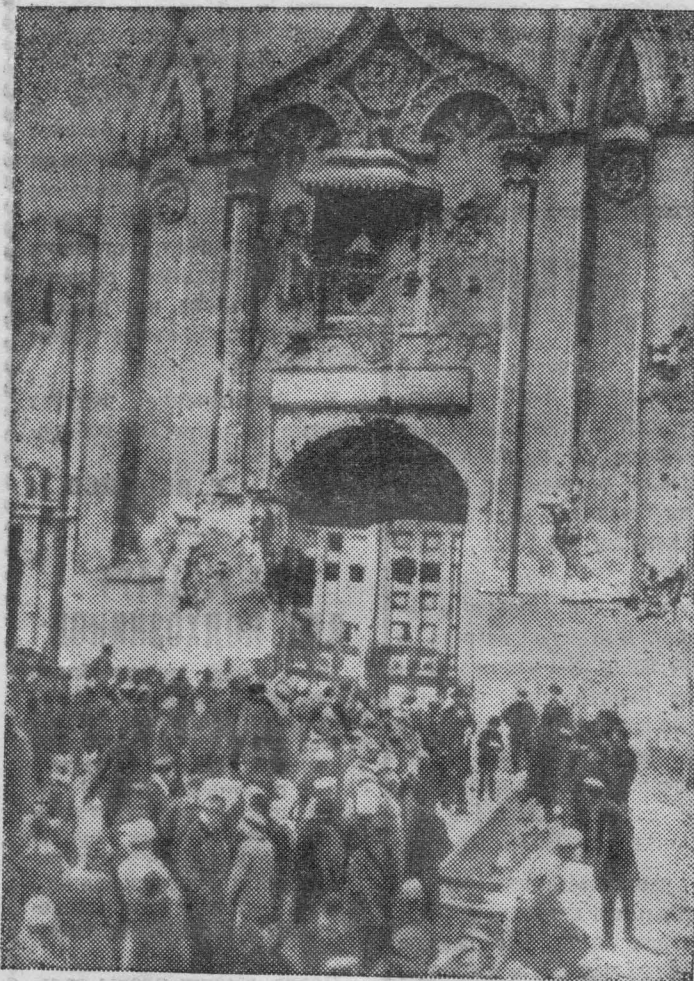
Ноябрь 1917 года. Кремль взят. У Никольских ворот. «КРАСНОЕ ЗНАМЯ» 28 января 1967 г., 2 стр. (Снимок из фондов Государственного музея революции СССР).