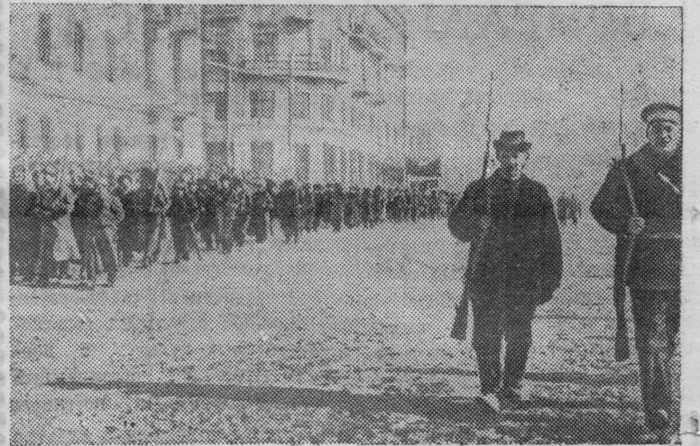
Чита. 1917 год. Красная гвардия.

Организовать Советскую власть в г. Иркутске, отстранив агентов Временного правительства Керенского и подчинив Советской власти все местные правительственные учреждения».