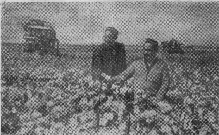
2000 хлопкоуборочных комбайнов собирают урожай «белого золота» на плантациях Таджикистана. Механизаторы колхоза имени Карла Маркса Курган-Тюбинского района решили за два сбора снять с каждого гектара по 30 центнеров хлопка-сырца.