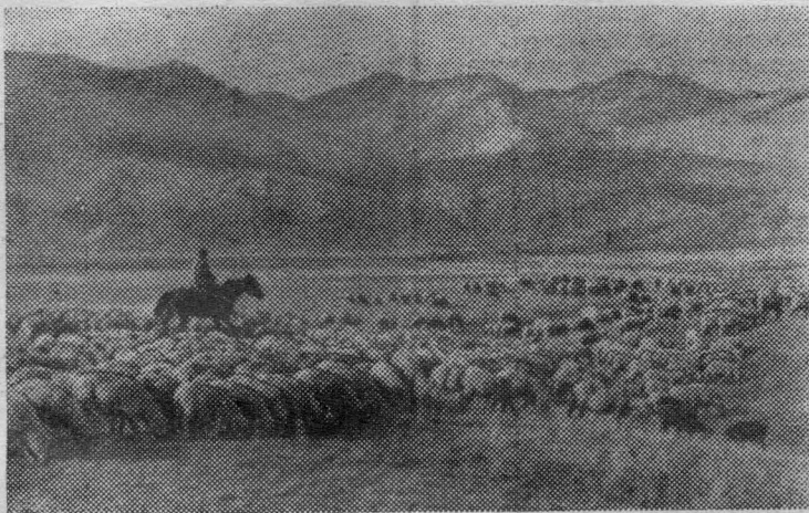
Около полумиллиона овец, табуны лошадей, стада коров пасут колхозы и совхозы Чуйской долины на пастбище Сусамыр.