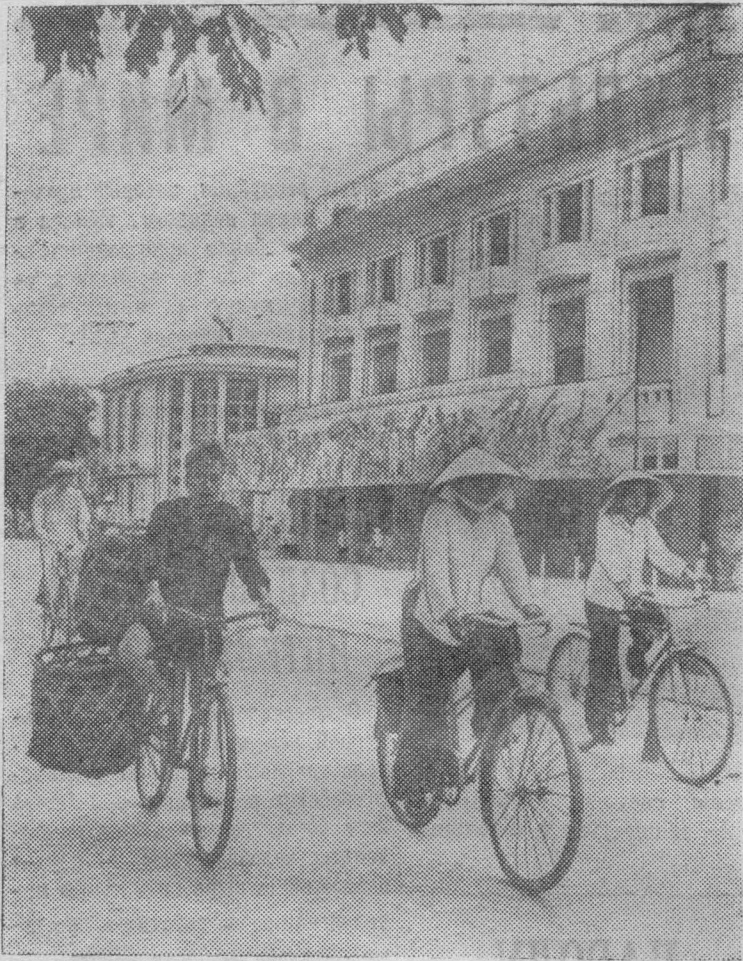
На снимке: на одной из улиц столицы ДРВ — Ханое.