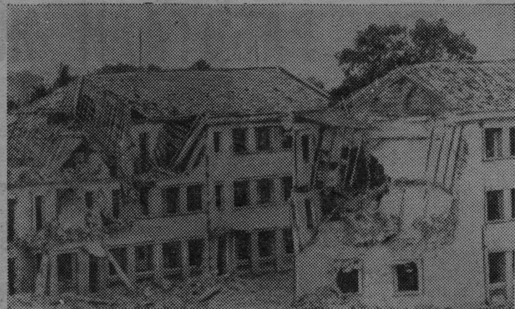
ДЕМОКРАТИЧЕСКАЯ РЕСПУБЛИКА ВЬЕТНАМ. Вот что оставили после себя американские стервятники в городе Ханои. В этих домах жили рабочие-электрики.

Коллектив комбината помогает земледельцам. Своей техникой рабочие прорывают каналы, соединяя пересохшие озера. В степи образуется сплошное море. Водой уже залито 11 квадратных километров. Используя сточные воды, хозяйства смогут освоить здесь тысячи гектаров новых земель.