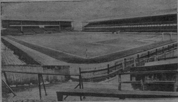
ВЕЛИКОБРИТАНИЯ. Стадион «Рокер парк» в Сандерленде. Здесь будут проходить первые игры на первенство мира по футболу 4-й группы, в которую входят команды СССР, Чили, Испании, КНДР.