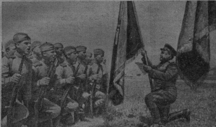
НА СНИМКЕ: воины у боевого знамени дают клятву биться с врагом до полной победы.

ством Коммунистической партии советские люди сумели мобилизовать свои силы для отпора захватчикам, проявили чудеса героизма, мужества, отваги в борьбе с врагом. Уже в декабре 1941 года Советская Армия