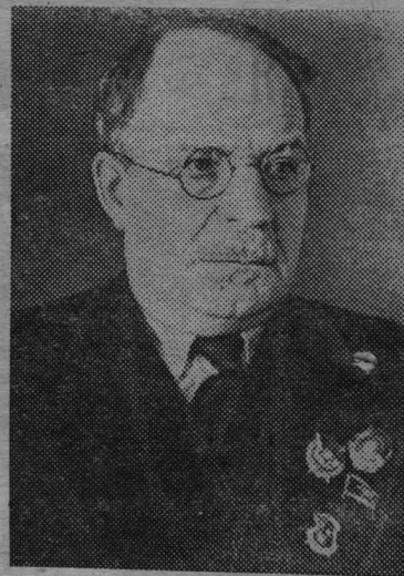
3 июня исполняется 90 лет со дня рождения выдающегося советского хирурга Николая Ниловича Бурденко (1876—1946). Он один из основоположников советской нейрохирургии.

Внук крепостного крестьянина, сын уездного писаря, Н. Н. Бурденко в 34 года стал профессором. Он создал основы научной теории современной военно-полевой хирургии. В годы Великой Отечественной войны Бурденко — главный хирург Советской Армии. Первым среди медиков в 1943 году он был удостоен высокого звания Героя Социалистического Труда. Ему принадлежит свыше 300 работ по различным проблемам клинической и теоретической медицины.