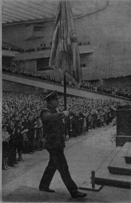
МОСКВА, Кремлевский Дворец съездов. XV съезд ВЛКСМ. НА СНИМКЕ: летчик-космонавт А. Леонов выносит знамя Ленинского комсомола.

Утром 20 мая на XV съезде ВЛКСМ председа-