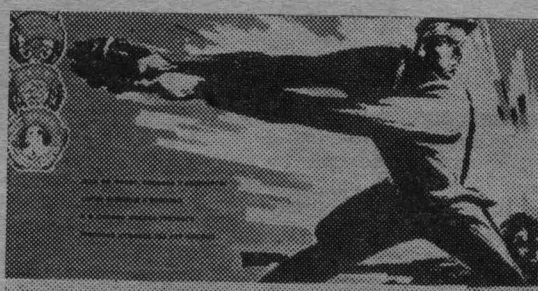
Шаги на фронт, угодили в бессмертие Сотни Чайкиных и Кошелевых. И в сиянии ордена третьего Грозный отблеск тех лет боевых.

АГИТПУНКТ избирательного участка № 134 — 281 расположен в красном уголке Промышленновского хлебоприемного пункта. Над входом висит лозунг, призывающий избирателей отдать голоса за кандидатов блока коммунистов и беспартийных. Рядом — плакат, извещающий о дне выборов. В зале, на столах, свежие газеты, журналы, настольные игры. На стенах — плакаты, лозунги. Видно, что наглядной агитации