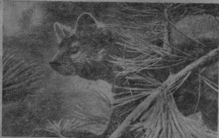
Вот он, соболя.

Хорошая добыча и у других охотников. Благодаря их труду Тункинский коопзверопромхоз по добыче пушнины вышел в число лучших в Бурятии. К открытию XXIII съезда партии коллектив охотников обязался выполнить две с половиной квартальные нормы.