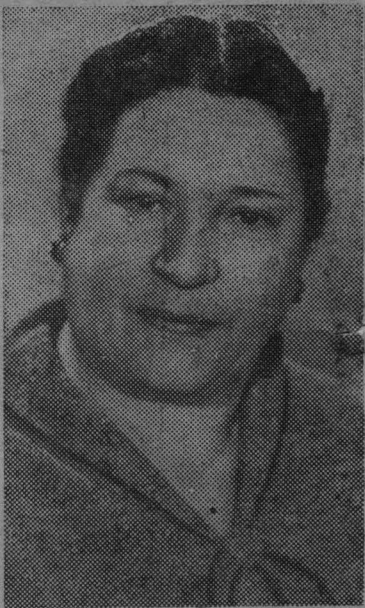
Сегодня исполняется 60 лет со дня рождения известной советской писательницы Агнии Львовны Барто. Юные граждане нашей страны горячо любят ее стихи, объединенные в сборники «Солнышко», «Считалочка», «Первоклассница» и другие. Произведения поэтессы отличаются неподдельным юмором, яркой образностью. А. Барто выдвинута на соискание Ленинской премии 1966 года.