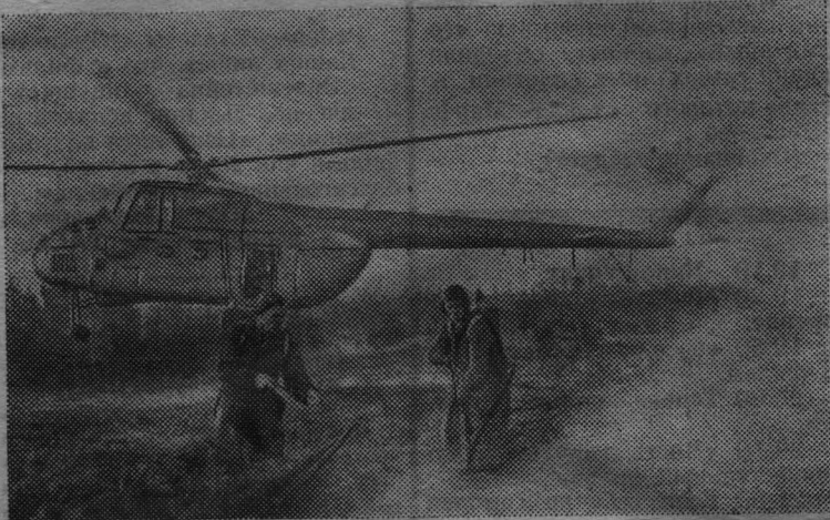
ТЮМЕНСКАЯ ОБЛАСТЬ. От Полярного круга до степей Кавказа, на площади, равной двум миллионам квадратных километров, ведет свою работу одна из крупнейших в стране Уральская база авиационной охраны лесов. Благодаря отличной работе оперативных отделений базы по ликвидации пожаров в тайге миллионы кубометров леса сохранены для народного хозяйства страны.

«КРАСНОЕ ЗНАМЯ» 25 октября 1966 г., 3 стр.