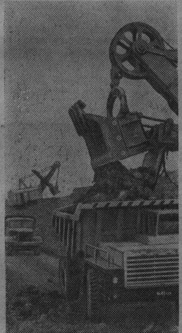
Сахалин. Уголь, добываемый открытым способом в Лермонтовском шахтоуправлении, по своей себестоимости самый экономичный на острове.

Добыча тонны угля в открытом разрезе обходится государству вдвое дешевле, чем в шахте.