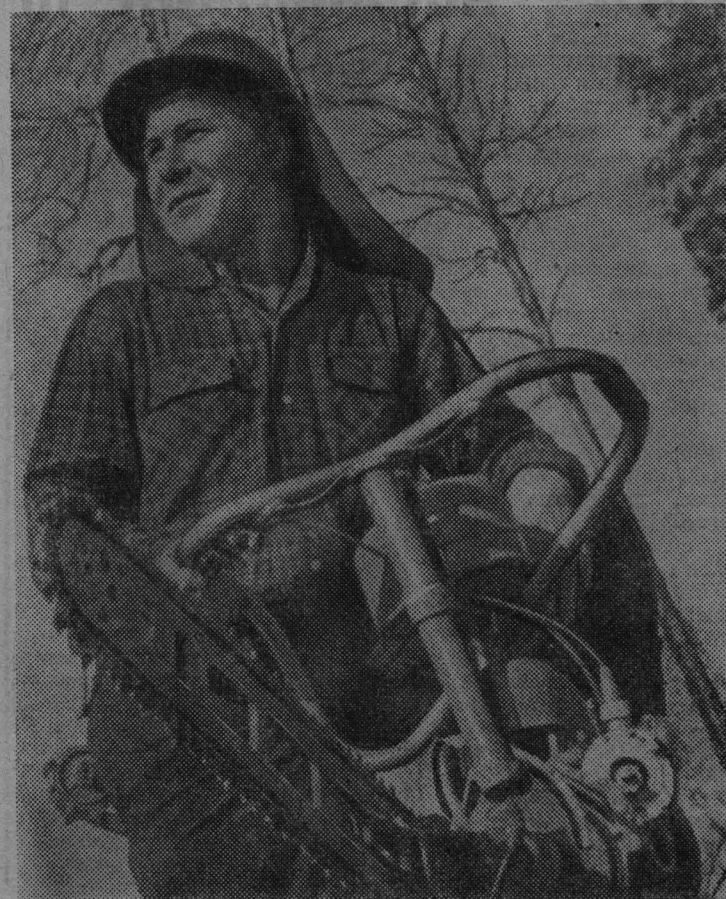
18 сентября в нашей стране впервые торжественно отмечается День работника леса. Труженники лесной, целлюлозно-бумажной, деревообрабатывающей промышленности и лесного хозяйства с чувством глубокого удовлетворения встретили Указ Президиума Верховного Совета СССР об установлении этого ежегодного праздника.

Таких в лесном хозяйстве немало. К празднику работников леса многие из передовиков представлены руководителями лесничеств и лесхоза, общественными организациями к поощрению.