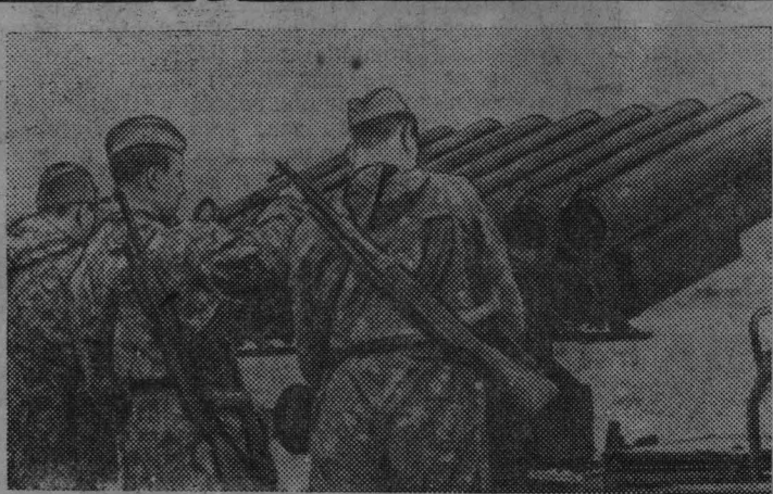
НА СНИМКЕ: воины гвардейской Краснознаменной ордена Суворова Таманской мотострелковой дивизии на учениях. Расчет готовит к стрельбе реактивную установку.