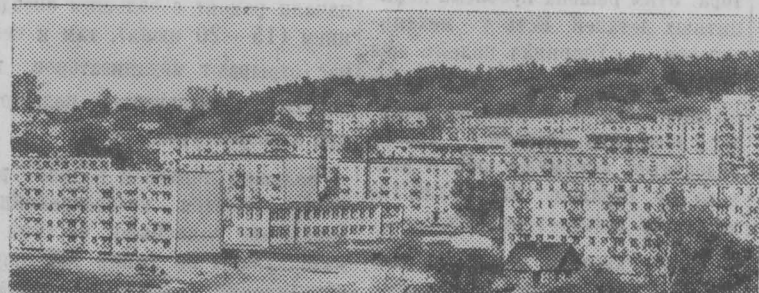
Жилые дома в новом районе Таллина — Мустамяэ. Сейчас здесь живет уже более 10 тысяч таллинцев.