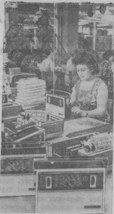
Рига. 21 июля исполняется 25 лет Советской Латвии. За эти годы выросла и изменилась столица республики. Построен ряд новых предприятий, культурных учреждений, учебных заведений, выстроены новые жилые районы.