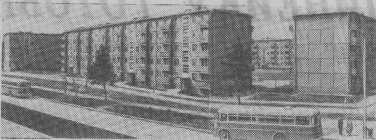
Вильнюс. 21 июля исполняется 25 лет Советской Литве. За эти годы выросла и изменилась столица республики. Построен ряд новых предприятий, культурных учреждений, учебных заведений, выстроены новые жилые районы.