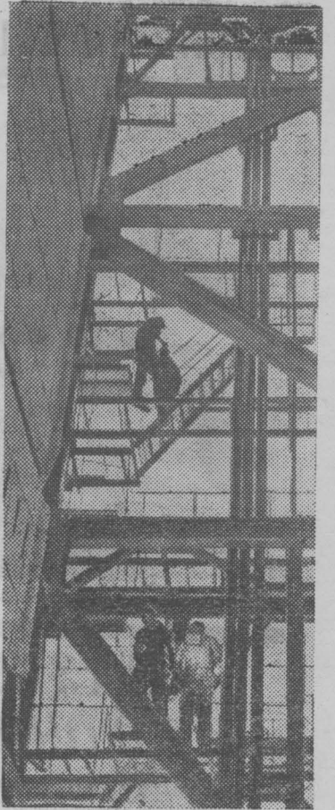
В энергосистему Узбекистана дал промышленный ток третий турбогенератор Ташкентской ГРЭС. Мощность его — 150 тысяч киловатт.

Г. НЕИЗВЕСТНЫХ, главный инженер управления.