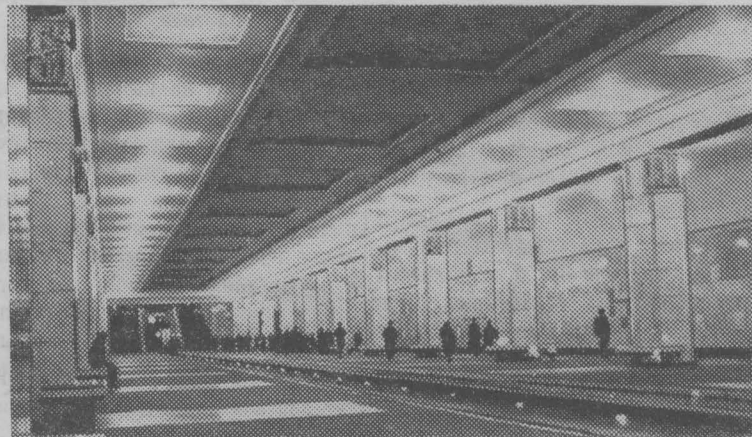
НА СНИМКЕ: станция метро «Пямайловский парк».

положены во всех районах Большой Москвы. Некоторые из