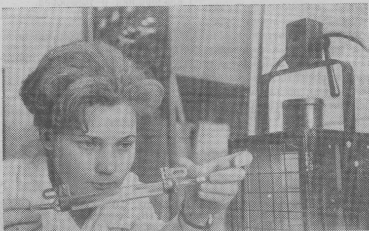
МОСКВА. В лаборатории одного научно-исследовательского светотехнического институ-

та созданы новые светильники для животноводческих и птицеводческих ферм, приборы для полевых сельскохозяйственных работ, аппараты для ультрафиолетового облучения сельскохозяйственных животных и птиц. Образцы новых приборов прошли промышленное испытание и приняты к массовому производству.