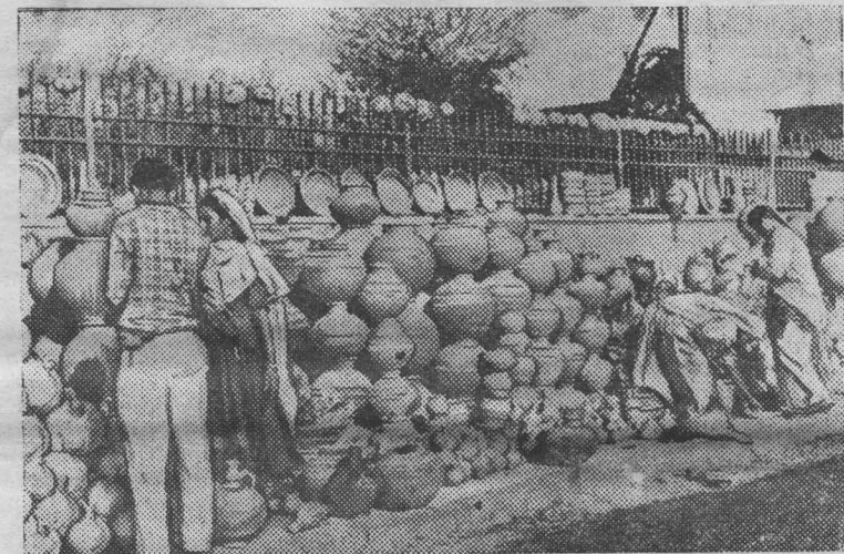
Индия. Дели. Продажа домашней утвари на улицах столицы.