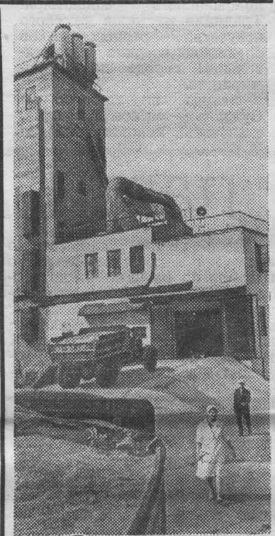
ТЮМЕНЬ. Сотни тонн зерна нового урожая приняла сушильно-очистительная башня Тюменского мелькомбината. Эта башня — большое, сложное сооружение. Она имеет диспетчерский пункт управления, оснащена совершенным оборудованием, все процессы — разгрузка машин, очистка и сушка зерна — механизированы и автоматизированы.

Производительность башни — 50 тонн зерна в час.