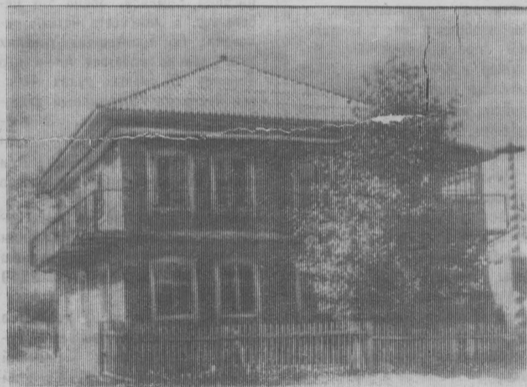
На снимке: здание гостиницы.