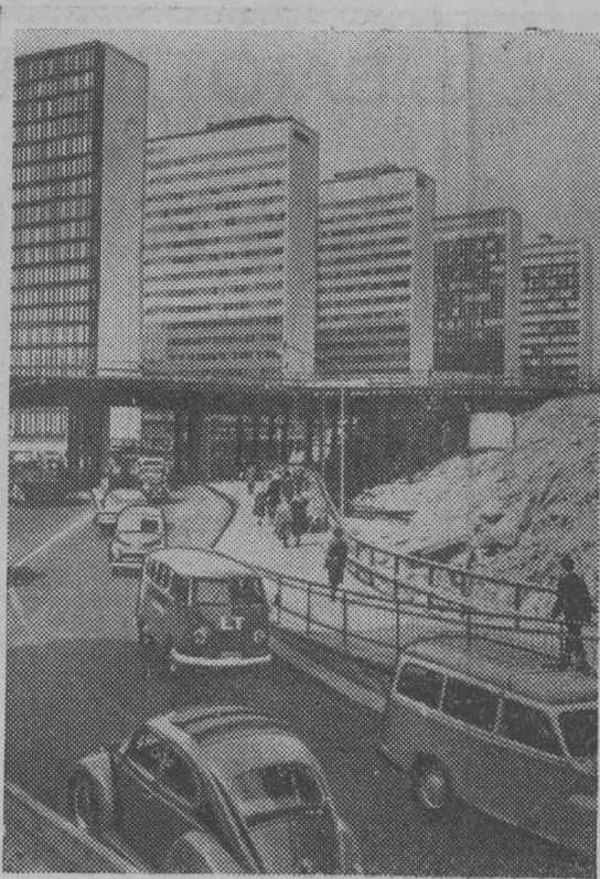
Столица Швеции Стокгольм. Новые дома.

Стороны высказали удовлетворение тем, что культурное и научно-техническое сотрудничество между Советским Союзом и Данией развивается благоприятно на основе соглашения о культурном сотрудничестве, заключенного в сентябре 1962 года. Была выражена готовность сторон продолжать и развивать такое сотрудничество в дальнейшем.