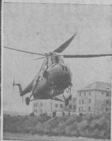
СССР. Человек попал в беду, необходима помощь, минуты решают все... И вот на помощь тяжело больным, находящимся в отдаленных районах сельской местности, в горах, приходят вертолеты. Они доставляют больных без промедления в больницы, госпитали, родильные дома. НА СНИМКЕ: вертолет приземляется близ Центрального госпиталя в Праге.