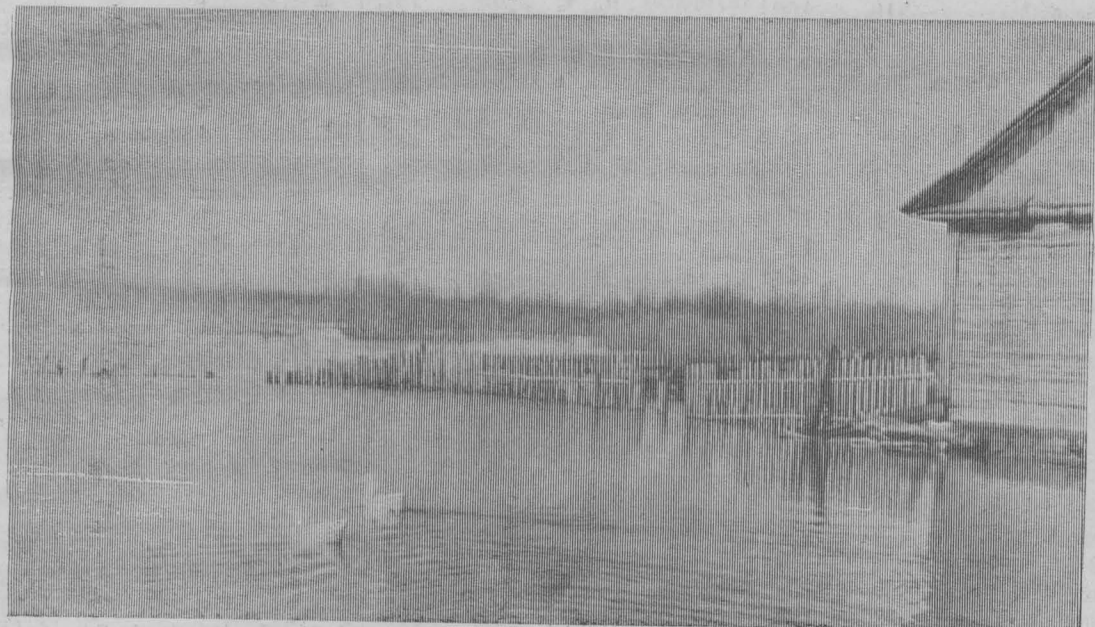
ШИРОКО РАЗЛИЛАСЬ ИНЯ В ЭТОМ ГОДУ.