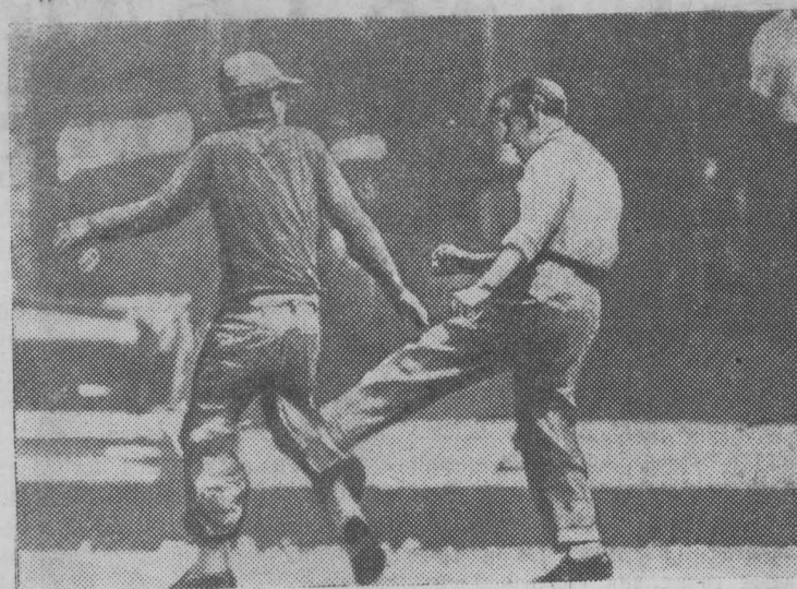
Чикаго Улица Вест мэдисон стрит. У витрины магазина маячит фигура безработного. По мнению владельца торгового предприятия, он может испортить настроение покупателей. Хозяин вышел из магазина и пинками прогоняет безработного. Этот момент и запечатлен фотокорреспондентом английской газеты «Санди экспресс».